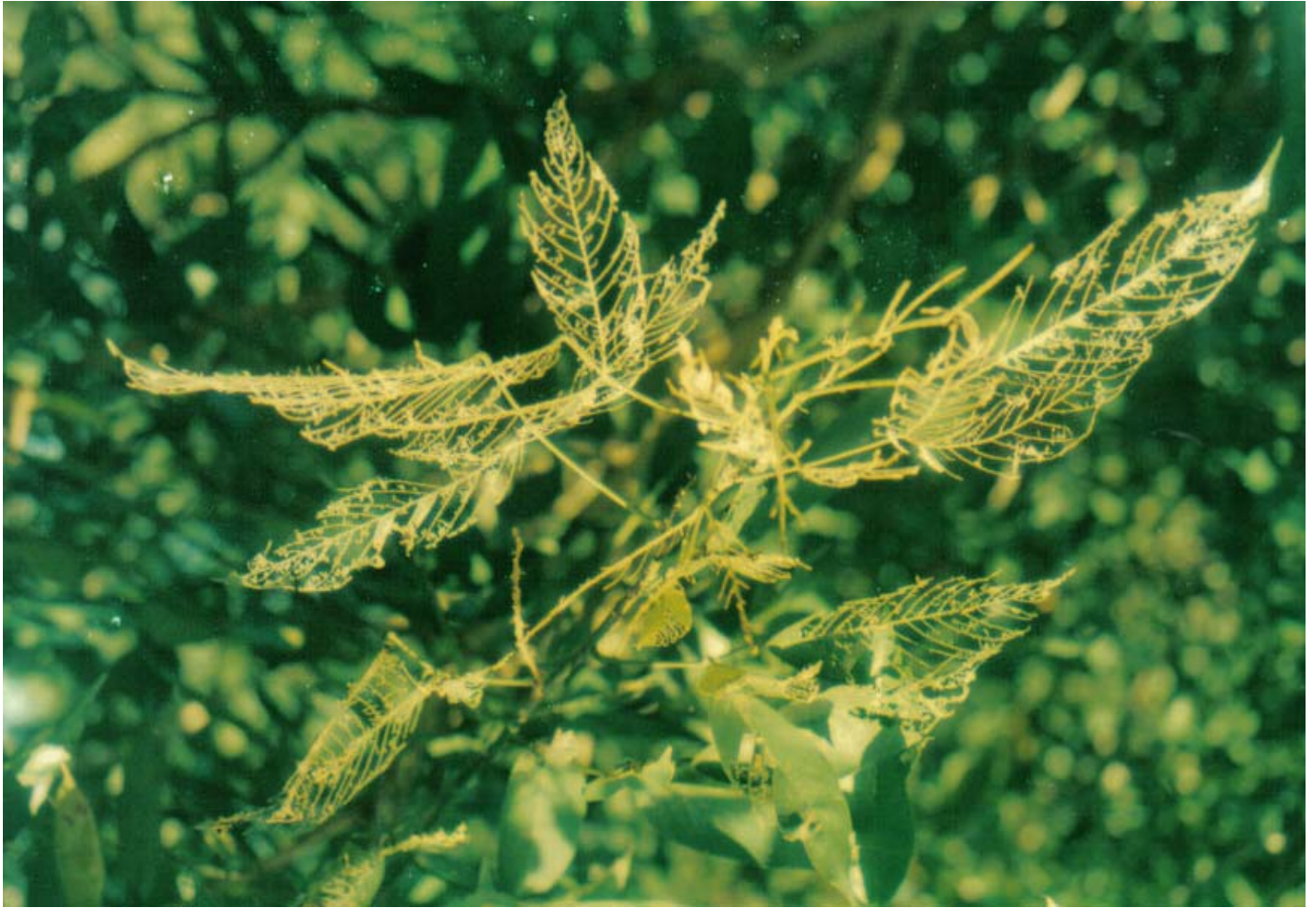
Anexo 7: Ramos de Clitoria fairchildiana , "sombreiro", totalmente desfolhada pelo ataque de Urbanus acawoios .