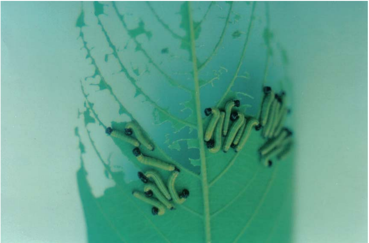
Anexo 6: Urbanus acawoios em diferentes fases de desenvolvimento larval Seropédica, 2005.