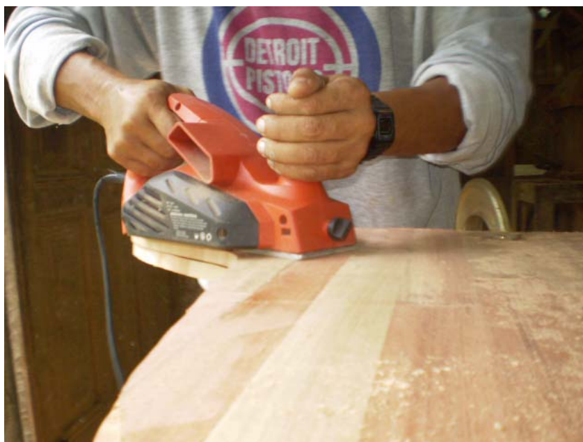
Figura 1 - Plaina elétrica.

Com os moldes cortados, uniram-se dois destes com adesivo PVA para fabricação de uma das laterais da cadeira, sendo um com a disposição dos sarrafos vertical e outro com disposição dos sarrafos horizontal, ou seja, um perpendicular ao outro. Esta disposição foi utilizada para adicionar maior resistência às laterais da cadeira assim como minimizar os efeitos de qualquer defeito existentes nas peças (nós, rachaduras ou delaminações da linha de cola). Este procedimento foi repetido para fabricação da outra lateral e para o assento e o encosto (Figura 6).