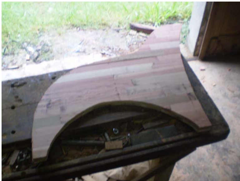
Figura 5 - Molde lateral da poltrona.