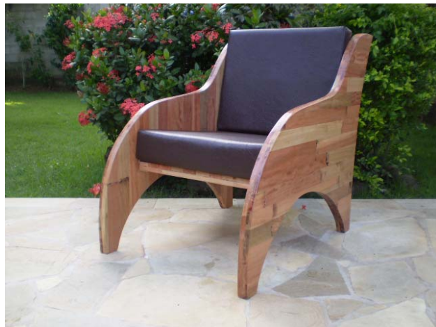
Figura 7 - Poltrona Bossa Nova.