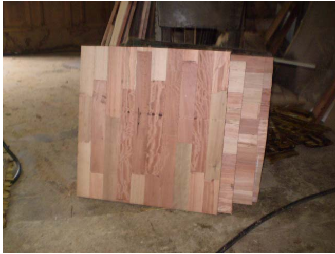
Figura 6 - Moldes dos acentos e encostos da poltrona.