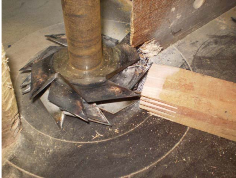
Figura 4 - Cinco fresas de aço inoxidável acopladas junto à tupia.