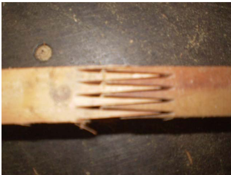
Figura 3 - Encaixe de topo tipo finger joint .