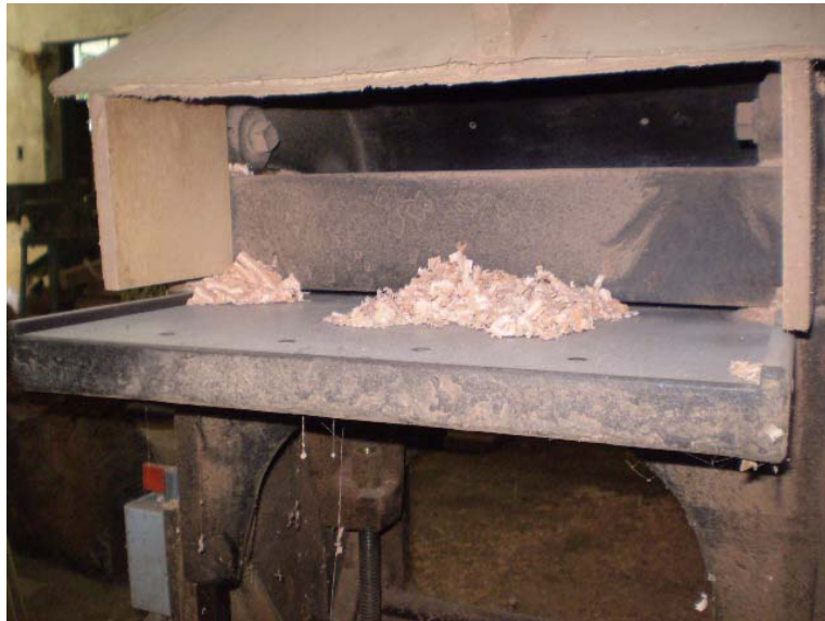
Figura 2 - Desengrosso.