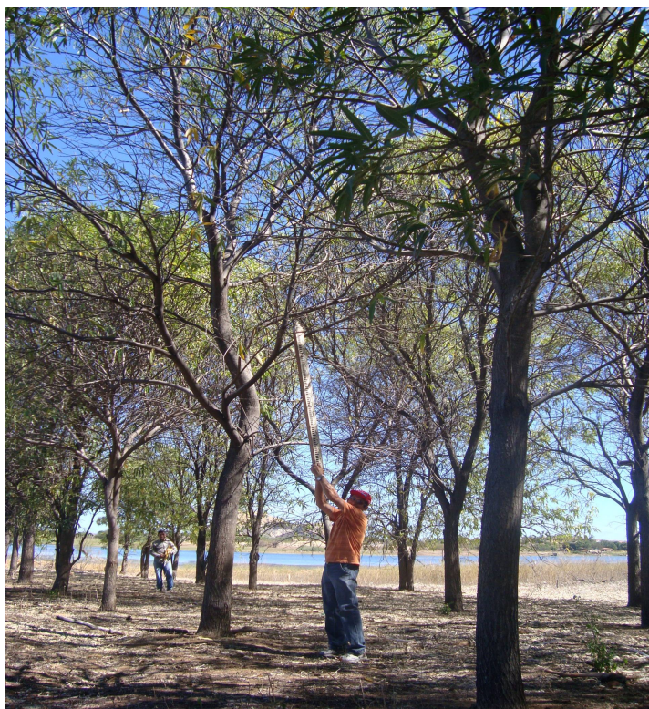
Vegetação na Fazenda Nupeárido - Município de Patos-PB