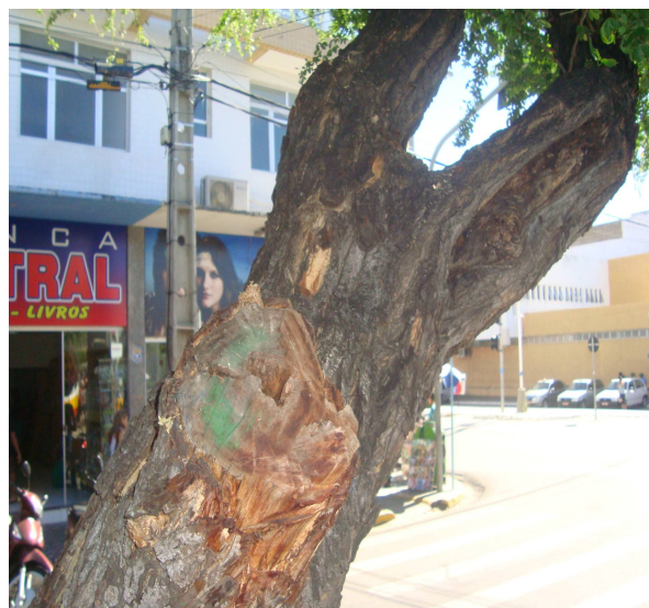
Figura 8. Necrose na base do tronco da algaroba (a) e da mata fome (b) presentes na Av. Pedro Firmino, sentido oeste, em Patos-PB

Nas Av. Solon de Lucena e Epitácio Pessoa, sentido sul, foram inventariados 9 indivíduos (Tabela 5) e verifica-se que houve mudança na arborização nesse setor onde a espécie nim é predominante e jovem e a maioria se encontra na classe de