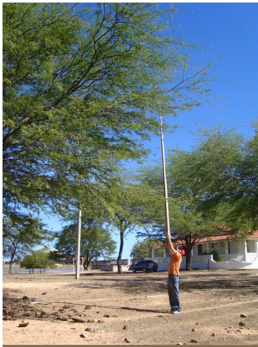
Figura 6. Medição da altura de indivíduos arbóreos com o auxílio de régua graduada

As espécies identificadas e selecionadas no cruzamento das avenidas Pedro Firmino e Sólon de Lucena, na faixa linear adotada (Tabela 1), fazem parte do paisagismo urbano do centro da cidade de Patos – PB.