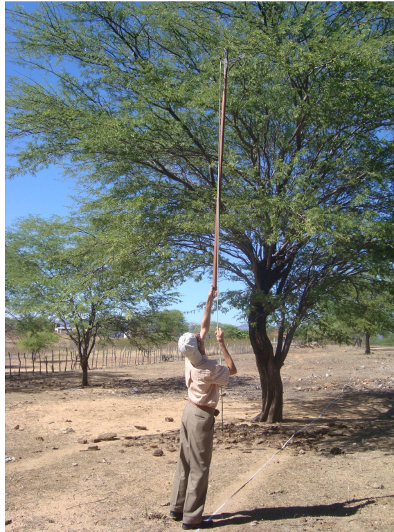
Figura 7. Coleta de material foliar utilizando o podão

Em cada indivíduo foram coletado em média 50 g de folhas nos sentidos norte, sul, leste e oeste, segundo Moreira (2010). As amostras das folhas foram acondicionadas em sacos de papel devidamente identificados e levados para secagem em estufa a 65 °C por 72 horas no Laboratório de Nutrição Animal/CSTR da UFCG em Patos. Após a secagem, as folhas foram moídas, em moinho do tipo Wiley.