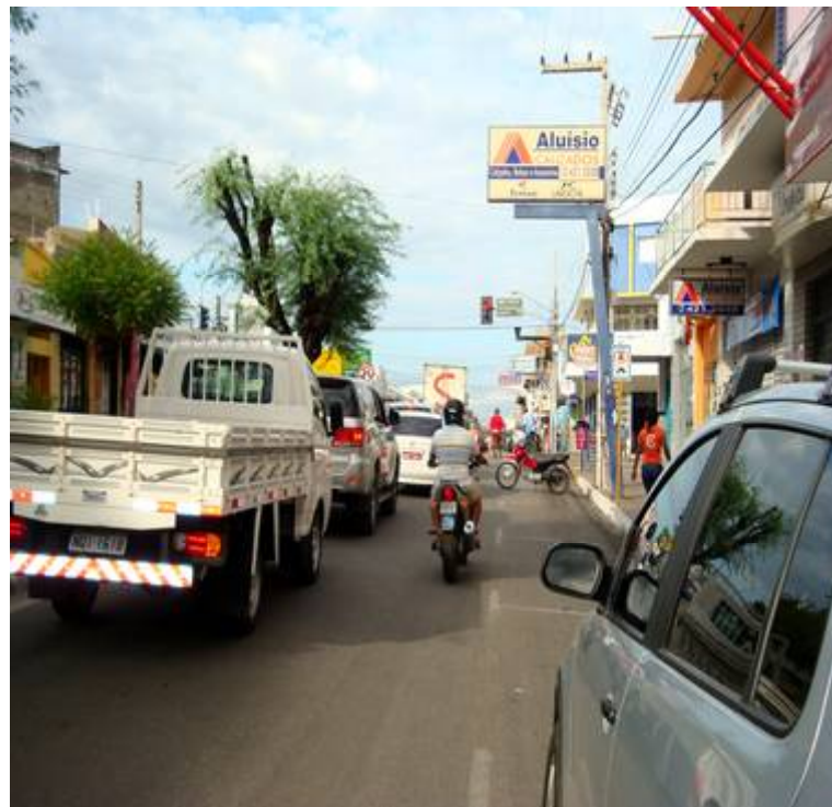
Vista geral da Avenida Pedro Firmino, sentido Oeste, em Patos-PB