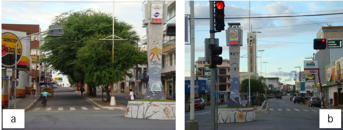
Figura 4. Vista geral da vegetação nas avenidas Pedro Firmino (a) e Solon de Lucena (b), no centro de Patos-PB

Todos os indivíduos vivos das espécies presentes nas áreas de amostragem que tinham circunferência à altura do peito (CAP) igual ou maior que 10 cm foram registrados sendo a circunferência mensurada com fita métrica (Figura 5) e a altura medida com auxílio de uma régua graduada (Figura 6).