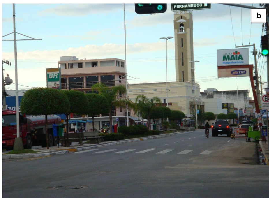
Avenidas Pedro Firmino, sentido Leste (a) e Solon de Lucena/Epitácio Pessoa, sentido Sul (b) em Patos-PB