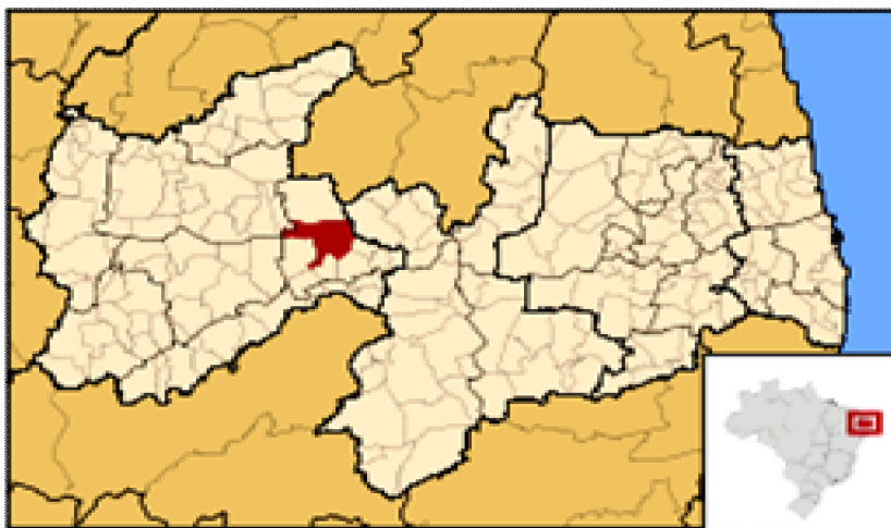
Figura 1. Localização do município de Patos, Estado da Paraíba, Brasil.

O estudo foi desenvolvido na cidade de Patos-PB, localizada na mesorregião Sertão Paraibano, distante 301 km da capital João Pessoa. A cidade localiza-se no centro do Estado com vetores viários interligando-a com toda a Paraíba e viabilizando o acesso aos Estados do Rio Grande do Norte, Pernambuco e Ceará (Figura 1).