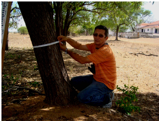
Figura 5. Medição da circunferência na base de indivíduos arbóreos utilizando fita métrica

Todos os indivíduos vivos das espécies presentes nas áreas de amostragem que tinham circunferência à altura do peito (CAP) igual ou maior que 10 cm foram registrados sendo a circunferência mensurada com fita métrica (Figura 5) e a altura medida com auxílio de uma régua graduada (Figura 6).