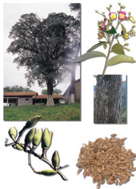
Açoita-cavalo, detalhes (folha, flor, sementes).

A grafia original Lühea passou a ser Luehea , segundo o Artigo 73.6 do Código Internacional de Nomenclatura Botânica ; o epíteto específico divaricata é em alusão