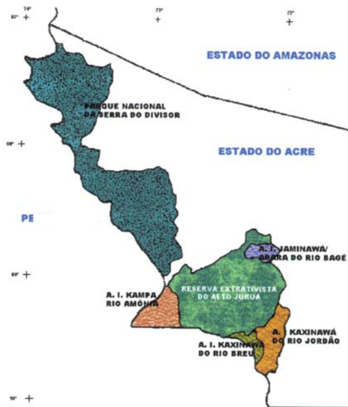
FIG 1. Localização e limites da Reserva Extrativista do Alto Juruá.