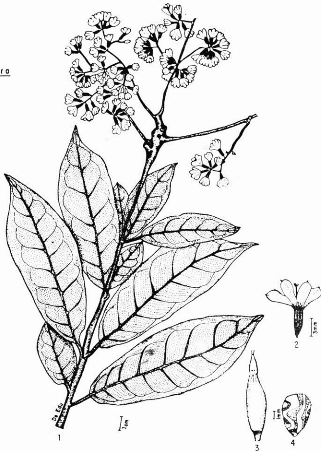
FIG. 1 — 1) Habitus; 2) Fruto; 3) Semente; 4) Embrião com cotilédone plicado.