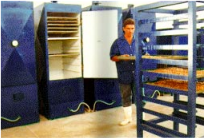
FIG. 6. Estufa desidratadora de amêndoas.

em seis horas, juntamente com suporte para bandeja e divisórias com prateleiras, para colocação das bandejas com amêndoas para repouso.