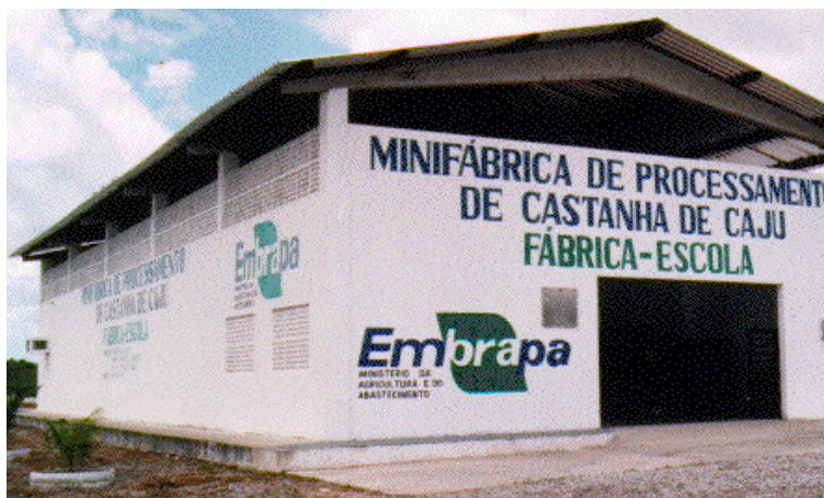
FIG. 1. Fábrica-escola de castanha de caju. Pacajus, CE.

6 Valores em real, referentes a janeiro de 2000.