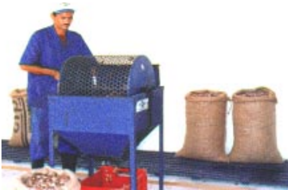
FIG. 2. Classificador manual de castanha.

O módulo para a implantação de uma minifábrica de processamento de castanha de caju é constituído por seis equipamentos básicos de pequeno porte, como classificador, cozedor, estufa, umidificador, máquina de corte, despeliculador e fritadeira, ajustáveis às necessidades de cada unidade industrial, com capacidade de processar diariamente desde 110 quilos de castanha em uma unidade de pequeno porte, até 5.500 quilos de castanha para um módulo agroindustrial múltiplo.