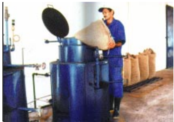
FIG. 3. Vaso cozedor para castanha in natura.

Vaso cozedor para castanha in natura (Fig. 3), construído em aço carbono com formato cilíndrico, encamisado para produção de vapor saturado, com os seguintes componentes auxiliares de operação: manômetro, visor de nível, válvula de segurança, montado em base de ferro com queimador a gás de cozinha, com capacidade para 50 kg de castanha por hora.