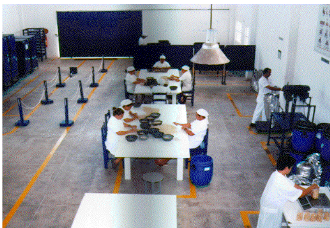
FIG. 5. Área interna da fábrica-escola.

Bancada de mesas para as operações de despeliculagem manual, seleção e classificação da amêndoa de castanha de caju (Fig. 5), confeccionada em chapa metálica ou madeira de lei, apoiada em quatro pernas, revestida com fórmica de coloração clara e opaca, apresentando as seguintes dimensões: altura 60 cm, largura 90 cm e comprimento de três metros.