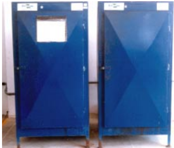
FIG. 7. Umidificador de amêndoas a vapor.

Umidificador de amêndoas (Fig. 7), construído em chapa metálica com porta e prateleira em perfil metálico para quatro a dez bandejas, munido de tubulação acoplada ao vaso cozedor com canalização para injeção de vapor saturado, com chave de controle de entrada de vapor e capacidade para umidificar 300 kg de amêndoas por dia.