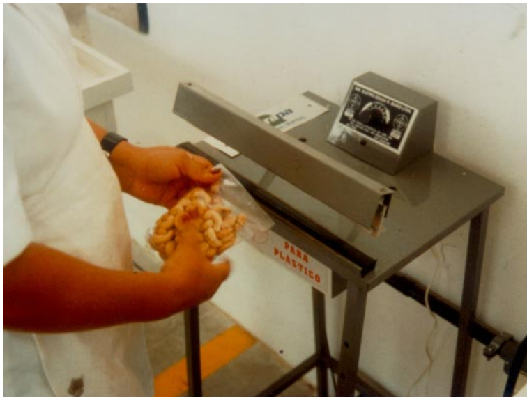
FIG. 10. Máquina seladora manual para sacos.

Máquina seladora para sacos plásticos ou aluminizados (Fig. 10), composta por caixa termostática, lâmpada piloto, chave deslizante para funcionamento automático, barramento de solda composta de resistência e barra de alumínio, protegida por pedal, com regulagem de calor e de tempo de soldagem, sem sistema de vácuo.