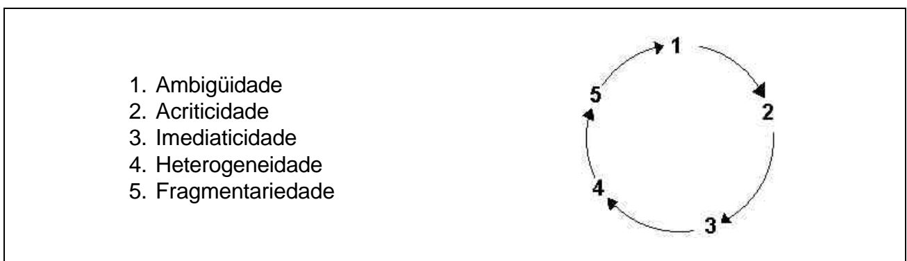
FIG. 2. Círculo da reciprocidade.

Esses dois levantamentos possibilitaram identificar as seguintes categorias: ambigüidade, imediaticidade, acriticidade, fragmentariedade e heterogeneidade. Para Gramsci, citado por Schaefer & Jantsch (1995), tratam-se de traços do conhecimento popular e estão presentes nos indivíduos subordinados economicamente na estrutura da sociedade. No entanto, não são resultantes dessa subordinação e sim das contradições reais, existentes e persistentes na sociedade. Com efeito, há uma relação de reciprocidade entre essas categorias, de maneira que a historicidade de uma é marcada pela historicidade da outra, formando o círculo da reciprocidade (Fig. 2).