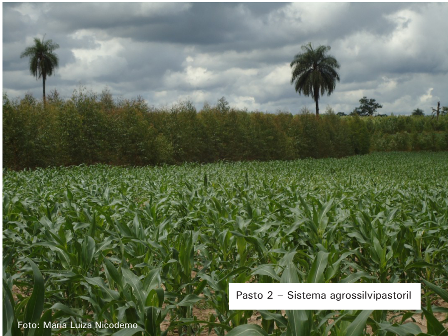
Pasto 2 – Sistema agrossilvipastoril