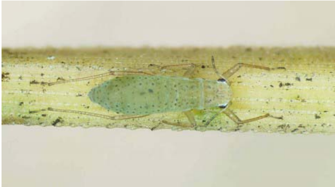
Adulto áptero de Essigella californica.