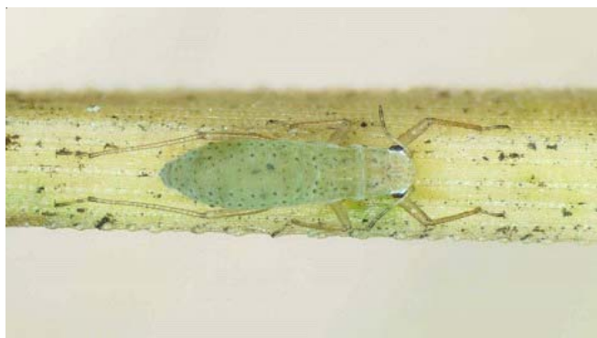
Figura 1 – Adulto áptero de Essigella californica.

Segundo Carver e Kent (2000), quando esse afídeo foi introduzido na Austrália, ele multiplicou-se e dispersou-se de modo devastador; posteriormente, chegou a um limiar tolerável, antes mesmo de serem tomadas medidas de controle. As possíveis razões para isso incluíram o tempo para adaptação da entomofauna de inimigos naturais, a resistência do hospedeiro e fatores climáticos, que inicialmente podem não ter sido muito efetivos.