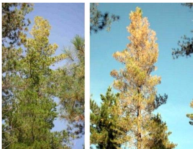
Figura 2 – Sintomas do ataque de Essigella californica

Os sintomas característicos são o amarelecimento e queda das acículas (Figura 2) (WHARTON e KRITICOS, 2004). Deve-se observar também a presença de plantas de pinus com as acículas e ramos enegrecidos, provocados pelo fungo simbionte, causador da fumagina.