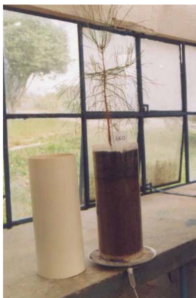
Figura 1. Ilustração de vaso com dispositivo para visualização das raízes e coleta de água de percolação.

A avaliação final dos ensaios foi realizada em 26 de junho de 2007. A parte aérea das mudas foi coletada cortando cada muda rente ao solo. Em seguida, procedeu-se a percolação, aplicando água destilada e deionizada na parte superficial de cada vaso em volume suficiente para a coleta de 2 L de água, a qual foi analisada para determinação de elementos químicos lixiviados.