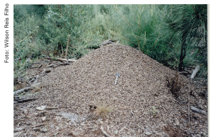
Figura 3. Ninho de A. crassispinus .

Os ninhos de Acromyrmex podem apresentar terra solta na superfície do solo, mas algumas espécies fazem seu ninho superficialmente coberto de palha, fragmentos e outros resíduos vegetais, enquanto outras constroem ninhos subterrâneos, sem que se perceba a terra escavada. Os ninhos de algumas espécies apresentam mais de uma câmara, podendo chegar a 26 câmaras e alcançar quatro metros de profundidade (FORTI et al., 2006; VERZA et al., 2007). O ninho de A. crassispinus é quase sempre superficial, com uma só câmara grande, em parte situada em uma escavação rasa, e inteiramente coberta por um monte de folhas secas e de resíduos vegetais que envolvem a cultura de fungo (Figura 3). Entretanto, há ninhos subterrâneos, com terra saliente sobre a panela ou próximo desta (GONÇALVES, 1961; MAYHÉ-NUNES, 1991).