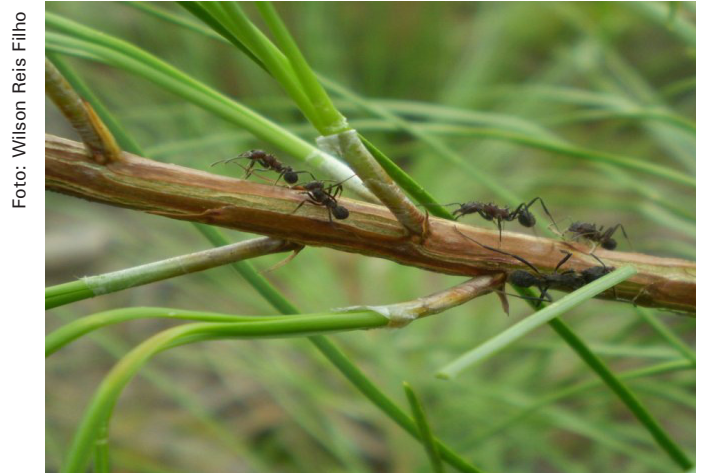
Figura 2. Formigas cortadeiras ( Acromyrmex crassispinus ) em Pinus taeda .

atacadas pela espécie (LINK et al., 2000). Essa espécie causa os maiores danos em plantios de Pinus taeda (NICKELE et al., 2009a) (Figura 2).