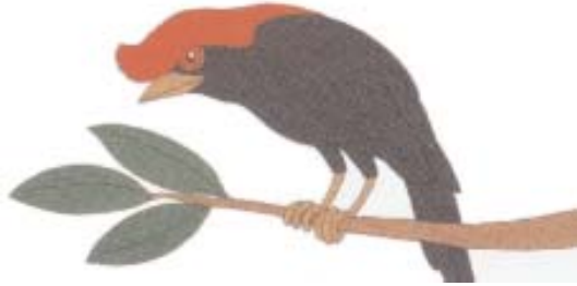
Fig. 1. “Soldadinho” ( Anthilophia galeata ), bioindicador de matas de boa qualidade.

Insetos diurnos, como libélulas com larvas aquáticas ou adultos alados (Odonata), gafanhotos, grilos e bichos-pau mastigadores de folhas (Orthoptera), cigarras e cigarrinhas (Homóptera), borboletas e mariposas (Lepidóptera), besouros detritívoros (Coleóptera), dentre outros, são avaliados