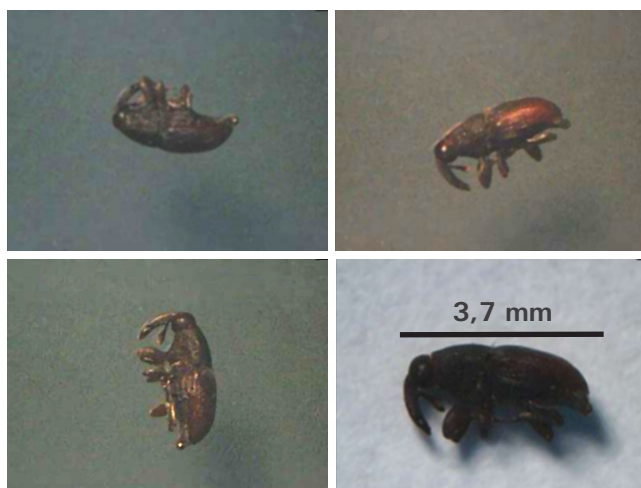
Figura 1. Adulto da broca-da-ponteira de mudas de cupuaçuzeiro.

O ataque às ponteiras ocasiona a emissão de brotações laterais, que também são colonizadas, causando deformações que tornam a muda inviável para enxertia, e, quando o ataque é intenso, a muda não serve para plantio.