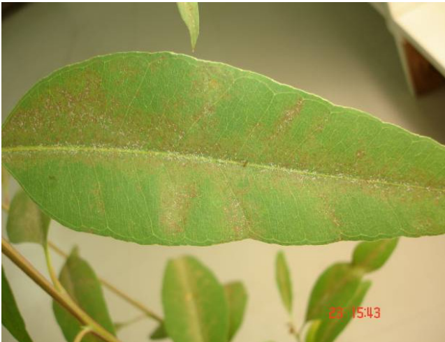
Figura 3. Oligonychus yothersi (McGregor) (Acari: Tetranychidae) em Eucalyptus grandis em casa-de-vegetação, Colombo, PR. A) ovo e fêmea à esquerda, macho, à direita e teias; B) danos na folha.

Tetranychus urticae (Koch) (Acari: Tetranychidae) T. urticae , popularmente conhecido como ácaro rajado possui coloração geral esverdeada, com as fêmeas apresentando dois ou mais pares de manchas escuras no dorso. Formam grandes colônias na face inferior das folhas e as recobrem de teias (FLECHTMANN, 1989).