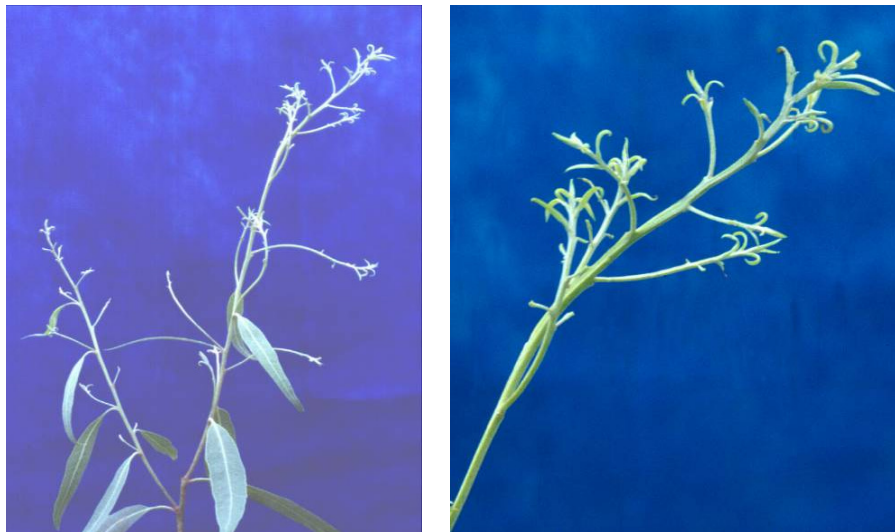
Figura 2. Danos de Rhombaculus eucalypti Ghosh e Chakrabarti (1987) (Acari: Eriophyidae) em Eucalyptus camaldulensis em casa de vegetação Colombo, PR.