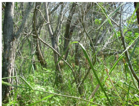
Período de verão (2008).