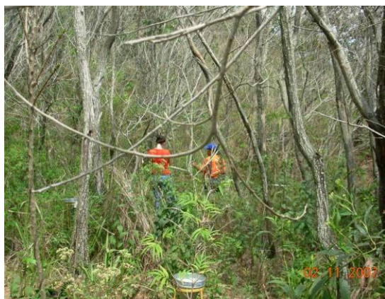
Período de inverno (2007)