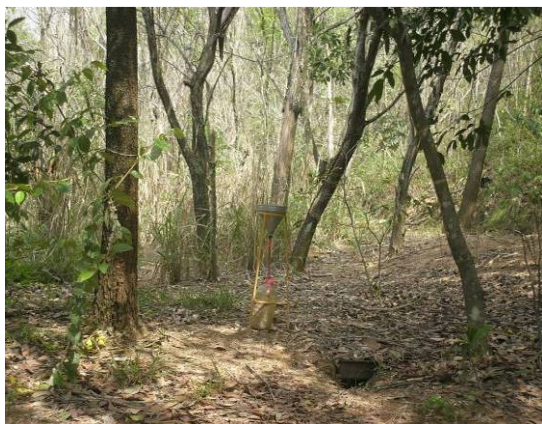
Período de inverno (2007).

Anexo I- 5: Tratamento (T4), após 13 anos de reabilitação da área de empréstimo da Ilha da Madeira-RJ.