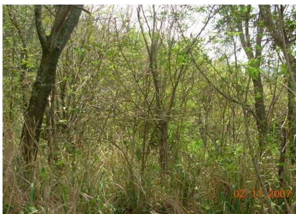
Período de inverno (2007).