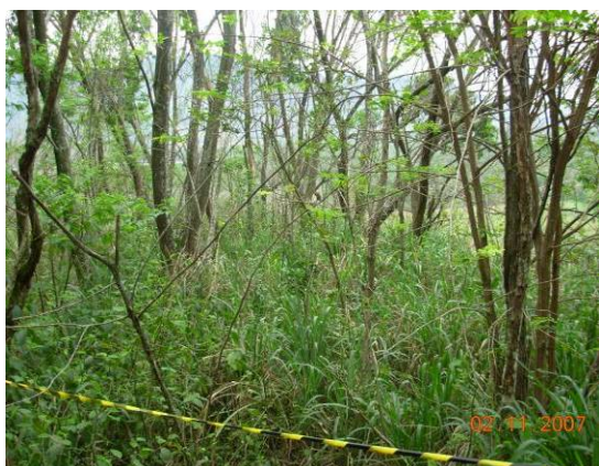
Período de inverno (2007).