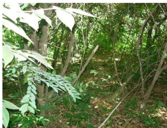
Período de verão (2008).