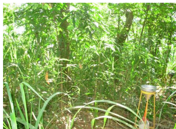
Período de verão (2008).