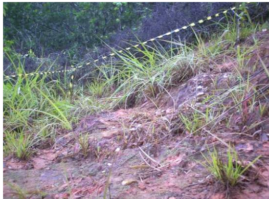
Período de inverno (2007)

Anexo I- 1: Área testemunha após 27 anos (1980-2007) de abandono do subsolo as ações do intemperismo na área de empréstimo da Ilha da Madeira-RJ.