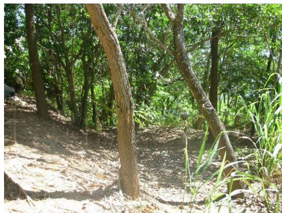
Período de verão (2008).