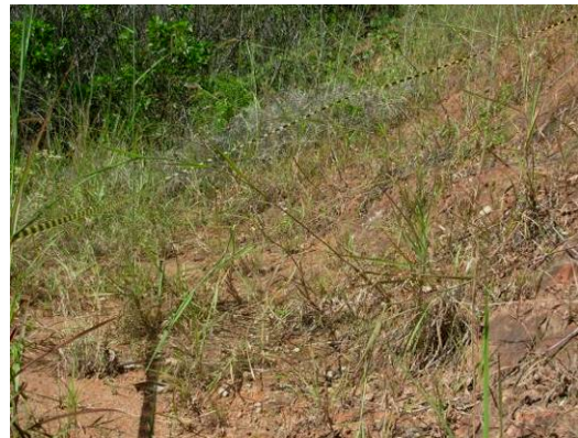
Período de verão (2008)