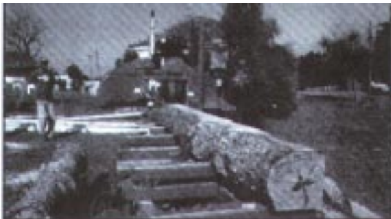
Figura 2. Serraria em operação, na propriedade da Embrapa Florestas .

A produção diária variou de acordo com a qualidade, espécie e tamanho das toras, mas sempre dentro de uma faixa de 6 a 11 m 3 . Uma produção diária média de 7 m 3 pode ser facilmente alcançada num turno de 8 horas. Com 21 dias de operação, isso equivale a uma produção mensal de 147 m 3 ou uma receita bruta de R$5.145,00.