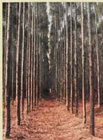
Programa de clonagem

ra para a produção de celulose, na idade de corte. Os clones aprovados são recomendados para plantio nas áreas da empresa em função de sua adaptabilidade às diferentes condições edafoclimáticas.