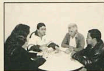
Visita do representante da Nortox