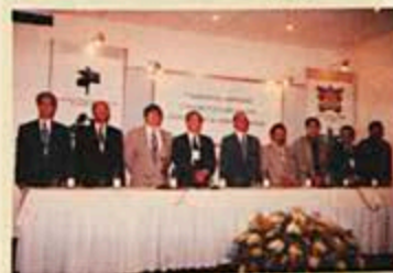
Solenidade de abertura do evento

Telefone: (031) 899-2381, 899-2888 / fax: 899-2107