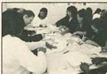
Capacitação dos professores envolvidos no projeto