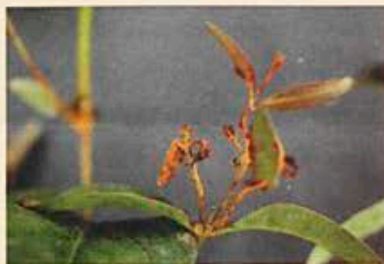
Ferrugem do eucalipto