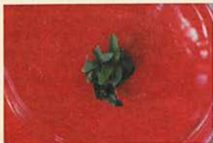
Regeneração "in vitro" de eucalipto

Encontra-se atualmente em execução o desenvolvimento de um protocolo para transformação genética de Eucalyptus e isolamento de genes que conferem resistência à ferrugem. O trabalho, em parceria com a companhia Suzano de Papel e Celulose, vem se desenvolvendo nos Laboratórios de Patologia Florestal / Marcadores Moleculares do Departamento de Fitopatologia e no Laboratório de Cultura de Tecidos do Departamento de Biologia Vegetal, todos funcionando no BIOAGRO da Universidade Federal de Viçosa. Este projeto servirá de modelo para futuros trabalhos de introdução de genes de interesse comercial em eucalipto.