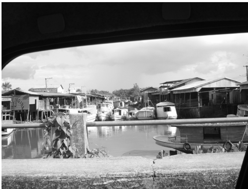
Figura 1. Ponto de compra e venda de madeira no Igarapé das Pedrinhas em Macapá (AP).

O presente estudo foi desenvolvido objetivando avaliar o potencial de utilização madeireira das espécies de várzea estuarina amazônica, no município de Mazagão, estado do Amapá, e estimar o estoque de madeira existente das espécies exploradas.