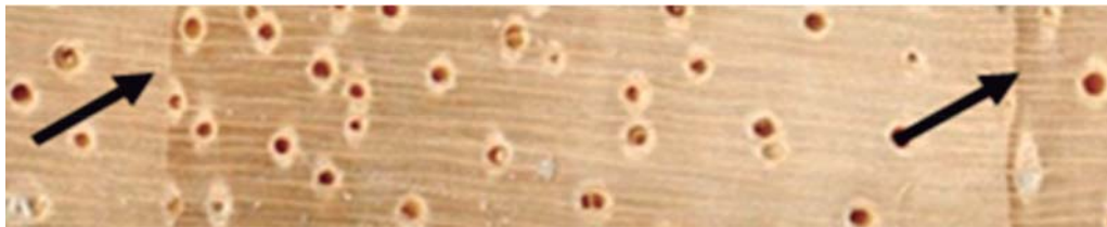
Figura 1 – Secção transversal do lenho de Schizolobium parahyba enfatizando os limites de um anel de crescimento. Figure 1 – Transverse section of Schizolobium parahyba wood emphasizing the limits of a growth ring.