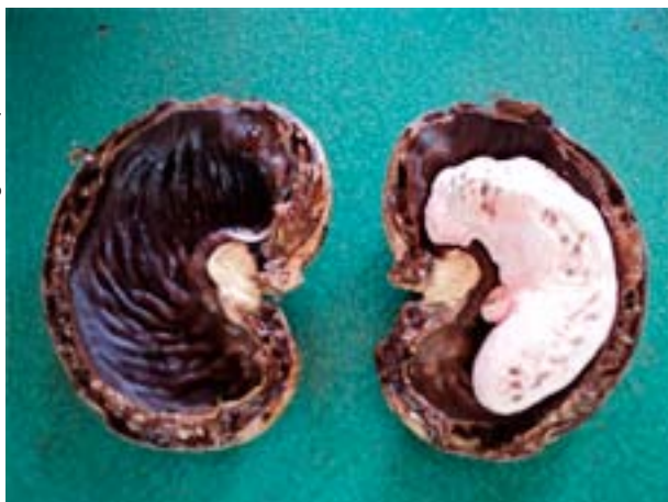
Figura 3. Castanha-de-caju logo após o cozimento e o corte para extração da amêndoa crua com película.

As amêndoas foram beneficiadas por meio dos processos de estufagem em vapor seco (60 °C a 70 °C) por um período de 6 a 8 horas, reumidificação (vapor saturado), estufagem final (70 °C a 80 °C) por um período de 8 a 10 horas e despeliculagem (PAIVA et al., 2000). Após o beneficiamento das amêndoas, foram determinadas as massas das películas e de todas as porções da amêndoa (inteiras, quebradas, bandas, batoques, etc.). Em seguida, de cada amostra processada,