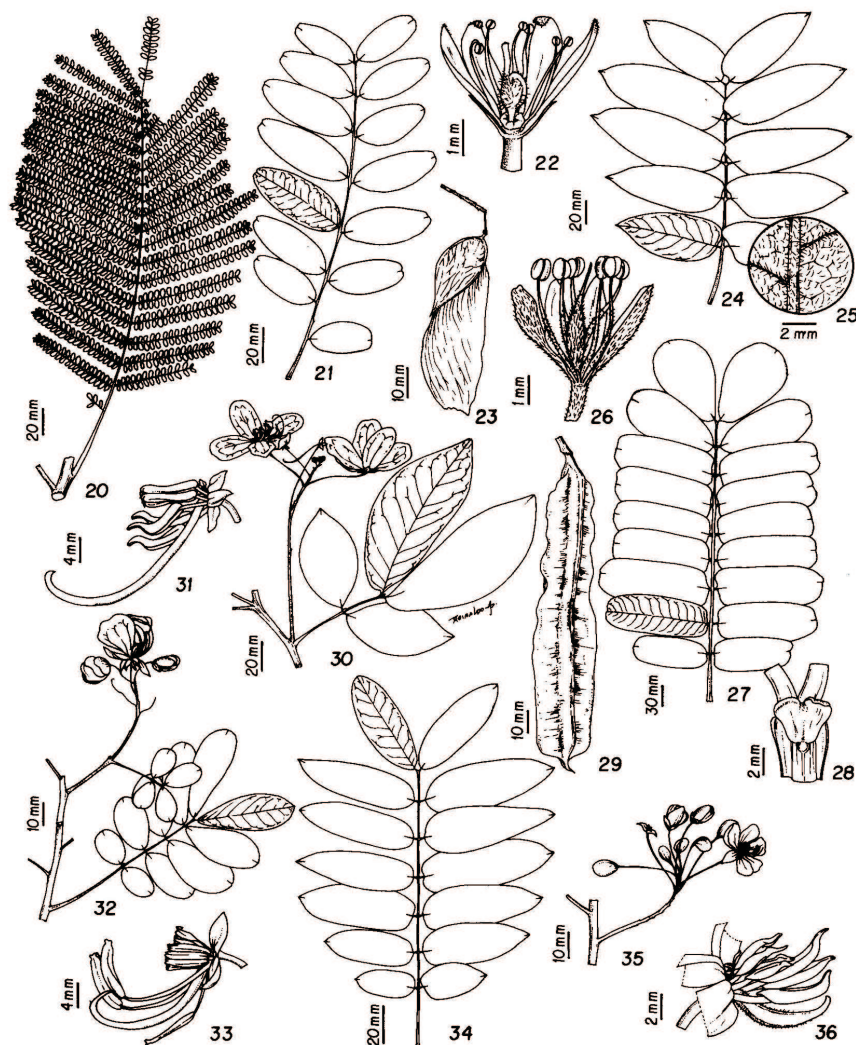
Figura 2 – Peltophorum dubium var. dubium : 20. Folha (Filardi et al. 451). Figuras 21-23. Pterogyne nitens : 21. Folha, 22. Flor em corte longitudinal (Filardi et al. 252), 23. Fruto (Filardi et al. 325). Figuras 24-26. Tachigali rubiginosa : 24. Folha, 25. Indumento na face abaxial do folíolo, 26. Flor em corte longitudinal (Filardi et al. 349). Figuras 27-29. Senna alata : 27. Folha, 28. Nectário extrafloral, 29. Fruto (Filardi et al. 522). Figuras 30-31. Senna macranthera : 30. Ramo floral (Filardi et al. 247), 31. Androceu e gineceu (Filardi et al. 441). Figuras 32-33. Senna pendula var. glabrata : 32. Ramo floral (Filardi et al. 505), 33. Androceu e gineceu (Filardi et al. 559). Figuras 34-36. Senna silvestris var. bifaria : 34. Folha (Filardi et al. 265), 35. Inflorescência, 36. Androceu e gineceu (Filardi et al. 431).

Fonte: Ilustrações de Reinaldo A. Pinto. Source: Illustrated by Reinaldo A. Pinto.