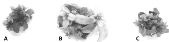
FIGURA 2: Aspecto das brotações de Eucalyptus benthamii x Eucalyptus dunnii aos 28 dias de cultivo in vitro em meio de cultura JADS (A), MS (B) e WPM (C) adicionado de 1,11 µM de BAP. Barra: 1cm.

A oxidação foi superior no meio JADS em relação aos outros meios em todos os subcultivos, assim como observado no experimento de