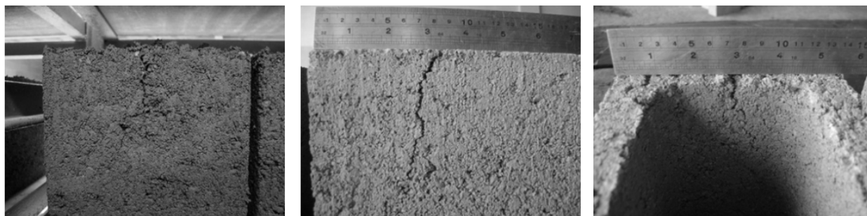
FIGURA 2: Exemplos de trincas em blocos devido à velocidade de desforma.

Quanto aos valores apresentados, verificou-se uma redução de 10,32% (média) da massa dos