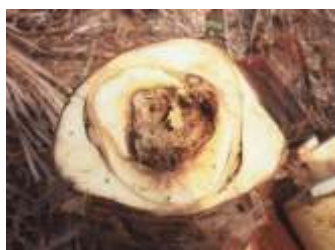
Fig. 6. Corte transversal do estipe, mostrando apodrecimento do meristema apical e de inflorescências.

secamento das folhas, a partir das mais velhas, que começam pelas extremidades e progridem no sentido ápice-base das folhas (Fig. 5). Nesse processo, freqüentemente verifica-se o secamento da flecha, devido à