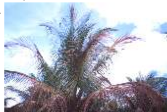
Fig. 5. Empardecimento e secamento ascendente de folhas.