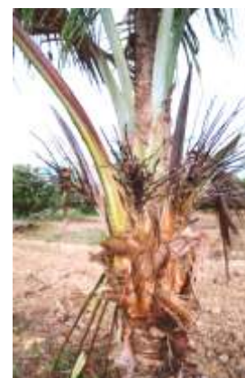
Fig. 3. Necrose de inflorescências, com secamento e queda de flores e frutos.

Os sintomas da murcha-de- Phytomonas manifestam-se primeiramente nas inflorescências, as quais são afetadas em diferentes estádios. Quando jovens e ainda fechadas, a necrose inicia-se na extremidade e avança para a base, tornando o tecido escuro e úmido, que exala um odor fétido. As inflorescências já abertas tornam-se necrosadas também a partir das extremidades (Fig. 3) e as flores, fecundadas ou não, secam e caem. Em plantas na