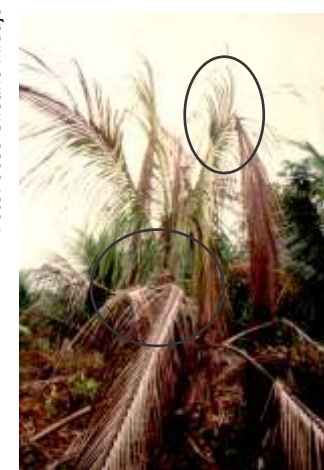
Fig. 7. Planta com secamento avançado da folhagem, mostrando ruptura das raquis na parte mediana ou proximal.