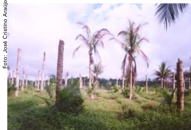
Fig. 2. Coqueiral destruído pela murcha-de- Phytomonas no município de Manaus - AM.