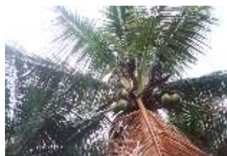
Fig. 4. Frutos desenvolvidos aderidos ao cacho.

fase inicial da doença, os frutos já desenvolvidos aparentemente não são afetados, permanecendo verdes e aderidos aos cachos (Fig. 4), enquanto os mais jovens secam e caem. Em seguida, ocorre o empardecimento e