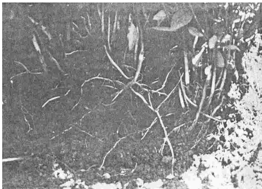
Foto 2. Brotos enraizados, na touça a partir de mergulhia de amontoa.