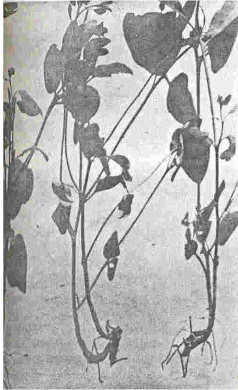
Foto 3. Mudanças de E. urophylla , individualizadas em condições a ser transplantadas.