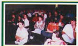
Um grande público esteve presente no Simpósio

No Brasil, a atividade de base florestal contribui com 4% do PIB e 10% das exportações totais, gerando cerca de dois milhões de empregos diretos e indiretos. A