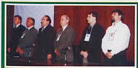
Autoridades universitárias presentes na solenidade de abertura do Simpósio