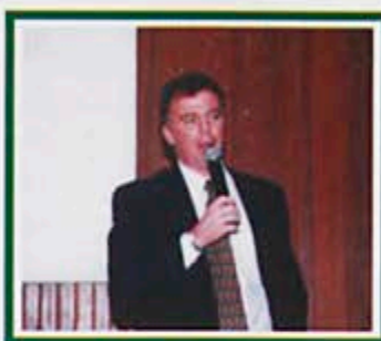
O ex-aluno da UFV e deputado federal José Renato Casagrande

nacional. As florestas do Brasil ocupam uma área aproximada de 450 milhões de hectares e contribuem com a melhoria da qualidade de vida das populações rural e urbana devido aos benefícios ambientais, econômicos e sociais que proporcionam.