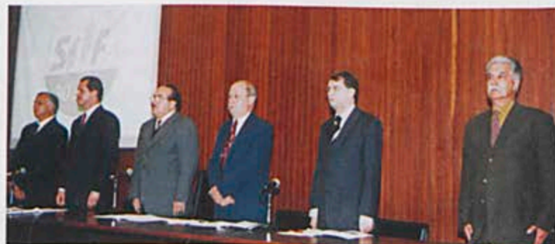
Autoridades da Mesa Diretora