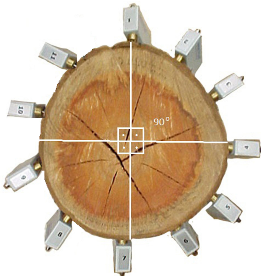
Figura 1 – Torette de Eucalyptus saligna com sensores do tomógrafo de impulso e seção transversal com marcação das posições de penetração da agulha do resistógrafo (a primeira coincidente com o primeiro sensor e as demais a cada 90°).

– S. As medições radiais foram realizadas em intervalos de 90°, sendo que a posição da primeira medição foi coincidente com a posição do primeiro sensor utilizado para a obtenção das imagens tomográficas (Figura 1). A profundidade de penetração da agulha foi de cerca de 15,5 cm, até que sua ponta encontrasse o centro da seção transversal. Tal método foi adotado para que a correta localização da passagem da sonda do resistógrafo pudesse ser identificada na imagem tomográfica, permitindo correlacionar as variáveis resistência à penetração e velocidade de propagação de onda mecânica. Essas linhas de passagem foram identificadas com a utilização do software de geoprocessamento TNT Mips versão 7.2. e recortadas das imagens.