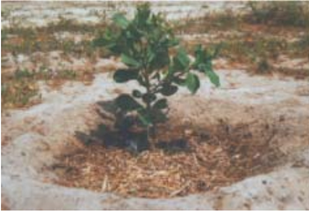
Fig.9. Emprego de cobertura morta em plannta jovem de cajueiro anão.