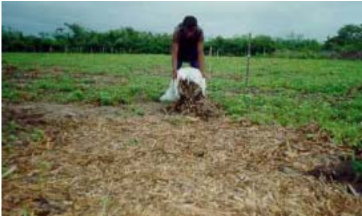
Fig. 8. Espalhamento manual da cobertura na área de cultivo.