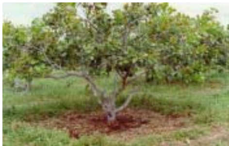
Fig. 5a. Cobertura do solo com bagana de carnaubeira ( Copernicia cerifera , L).