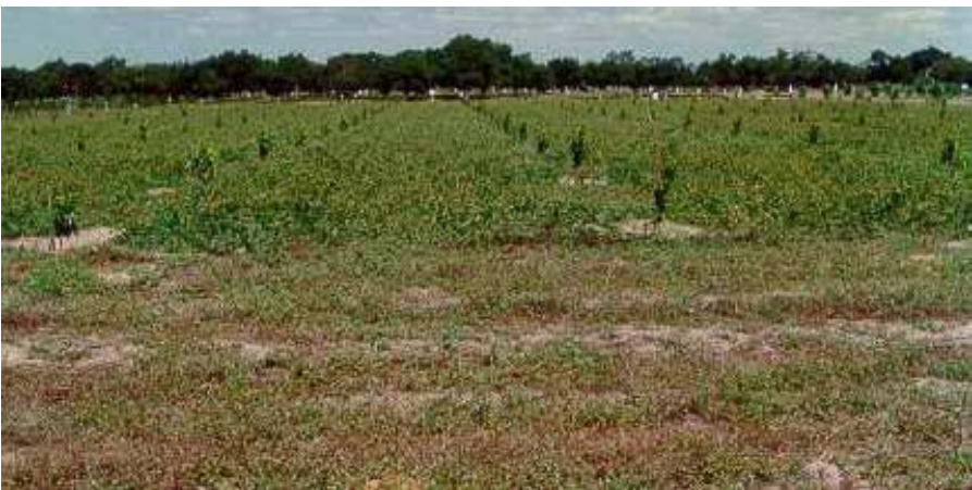
Fig. 3. Cobertura permanente do solo com Calopogonium muconoides .