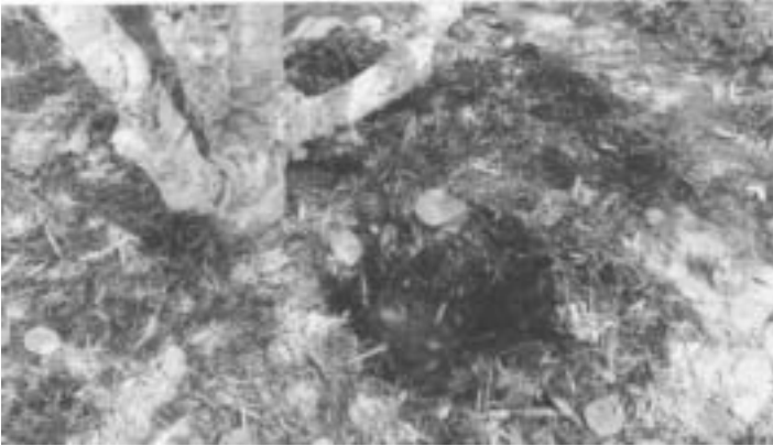
Fig. 7. Manutenção da unidade do solo na zona de cobertura morta.