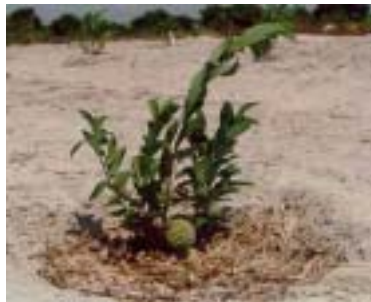
Fig. 5b. Cobertura localizada do solo com restos de cultura em ateira.

Oliveira & Ramos (1993), estudando a composição química da bagana de carnaubeira, obtiveram os seguintes resultados (Tabela 2).