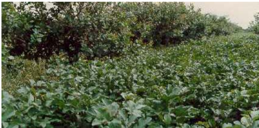
Fig. 2. Cobertura do solo com leguminosa.