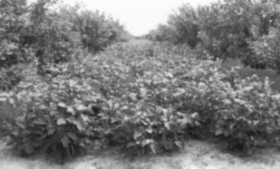
Fig. 4. Cultivar intercalar de leguminosas com cajueiro precoce enxertado.