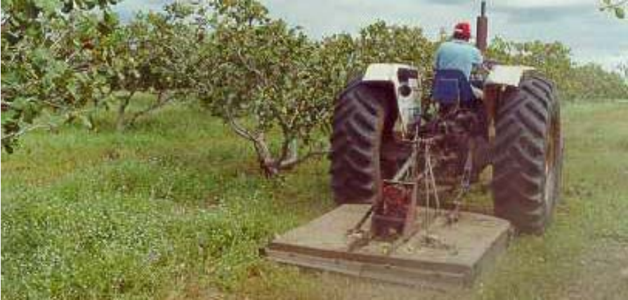
Fig. 1. Solo coberto com vegetação, através do roço mecânico.