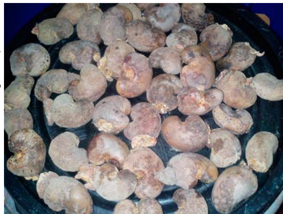
Figura 2. Castanhas-de-caju com diferentes intensidades de oídio.

Amostras de castanha-de-caju com e sem oídio foram levadas para o Laboratório de Fitopatologia da Embrapa Agroindústria Tropical, onde foram individualmente pesadas e mensuradas quanto ao comprimento,