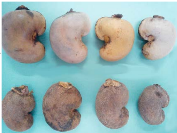
Figura 1. Castanhas-de-caju sem sintomas de oídio (na parte superior da figura) e com sintomas (na parte inferior).