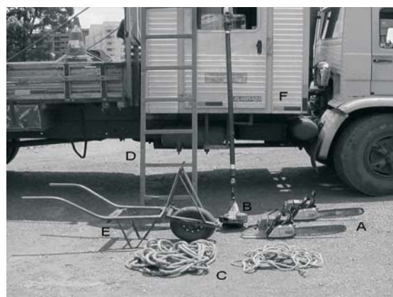
A) motosserra; B) motopoda; C) cordas; D) escada; E) carrinho adaptado para carregar troncos; e F) cabine adaptada no veículo de transporte dos trabalhadores.

Todas as oito equipes de poda tiveram suas máquinas, equipamentos e ferramentas avaliados individualmente por cada item do “check-list” (Figura 3).